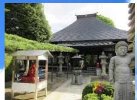
石造物が多い蓮花寺