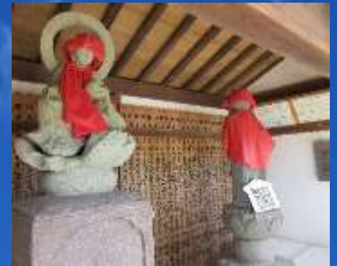
妙法寺の義民地蔵