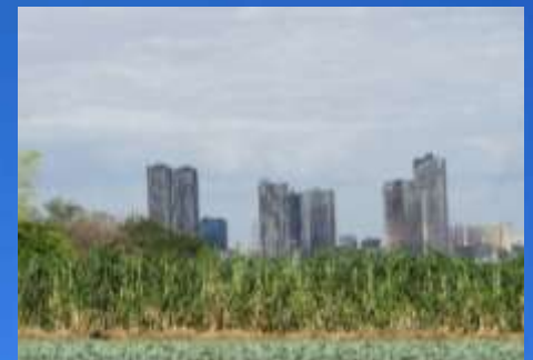
台地に広がる野菜畑と小杉高層マンション

◇集合 ①JR南武線溝ノ口駅改札口前 12:20までに集合。溝口駅南口1番乗り場から【溝25】12:35分発のバスに乗ります。