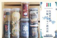
川崎イイモノ直売所