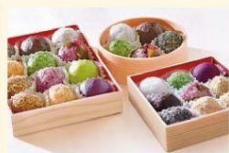
おはぎ専門店 ももすず