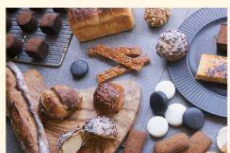
Len -Local Speciality Factory-