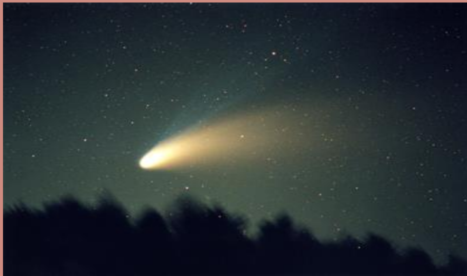
美しい尾を伸ばしたヘールボップ彗星 1997年4月 八ヶ岳山麓にて撮影

多摩天文グループは、1972年に結成し、川崎市内を中心に活動を続けている30名あまりの天文同好会です。今回の写真展は、結成50周年を記念し、1972年～2022年に撮影した80点あまりの天体写真をご覧ください。この50年間に会員が捉えた大彗星や流星、皆既日食、皆既月食、星雲星団、月、惑星など美しい星々の姿をご覧ください、天文現象や天体の魅力をお伝えしたいと思います。