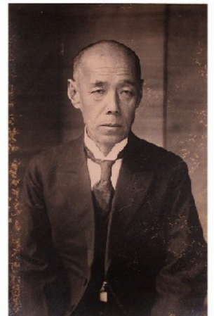
石井泰助肖像写真(60歳) 大正13(1924)年頃(初代川崎市長)