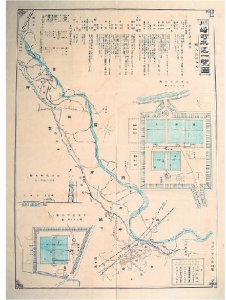
川崎町水道一覽図(複製) 大正10(1921)年

川崎市水道100周年を記念した本展では、水道敷設時の資料や、市制施行前後からその後の都市形成を表す水道関係の資料など約50点を展示し、川崎における水道の歴史をたどります。