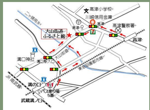
JR南武線武蔵溝ノ口駅より徒歩7分 東急田園都市線高津駅より徒歩5分

※お申し込み後、参加できなくなった場合は、ご連絡いただきますようお願いいたします。