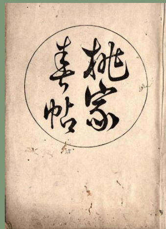
嘉永6年(1853)『桃家春帖』 講師所蔵