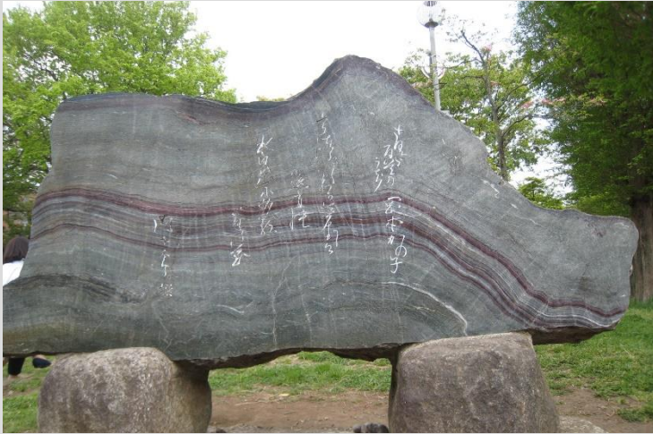
岡本かの子文学碑（高津図書館前）