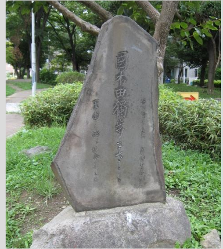
国木田独歩文学碑（高津図書館前）

令和2年度第1回目となる「ふるさと探究講座」は、高津区の大山街道沿いに残る文学碑について学びます。高津地域は、二子で育った岡本かの子や、溝口亀屋旅館を作品に描いた国木田独歩など、様々な文人との関わりがあります。そうした文人たちの足跡を記憶する文学碑は、現在も高津の各地に残されています。今回はこの文学碑を入りに、高津と文人たちとの関わりについてご紹介いたします。