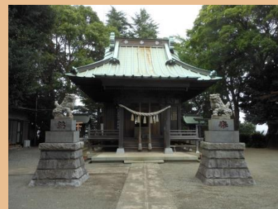
高台に鎮座する新作八幡宮