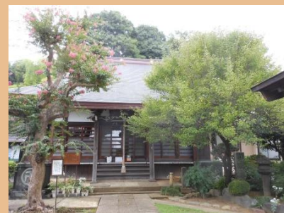
飛天図天井絵がある龍台寺