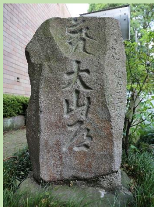
世田谷区立郷土資料館に保存されている大山街道の道標