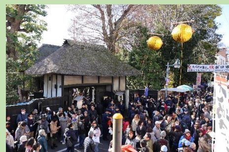
世田谷代官屋敷表門と賑わうボロ市通り

赤坂御門を出た大山街道は、青山、渋谷、三軒茶屋を経て、二子の渡りで多摩川を渡り、現在の神奈川県域へと続きます。この講座では、江戸時代の紀行文に描かれた都内の大山街道をたどりつつ、現在も街道を歩けば見ることができる道標や寺社を紹介します。旅人で賑わった三軒茶屋、代官屋敷で有名な世田谷、境内からの眺望が名高い瀬田行善寺などを取り上げ、かつての街道の様子を見ていきます。