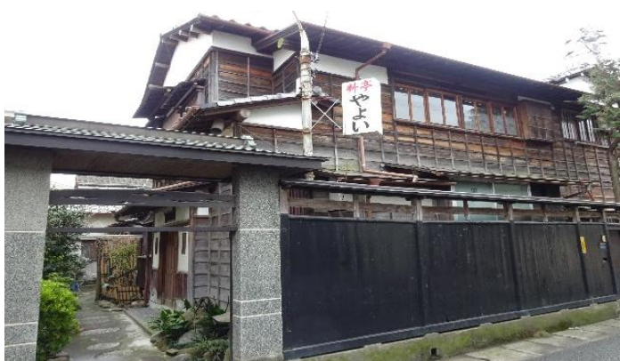
料亭 や よ い