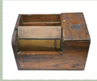
ハ工取り器 川崎市民ミュージアム所蔵