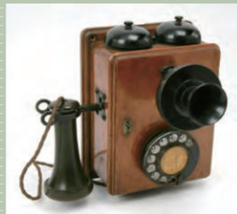
ダイヤル式電話機 昭和2(1927)年〜昭和20(1945)年頃 川崎市民ミュージアム所蔵