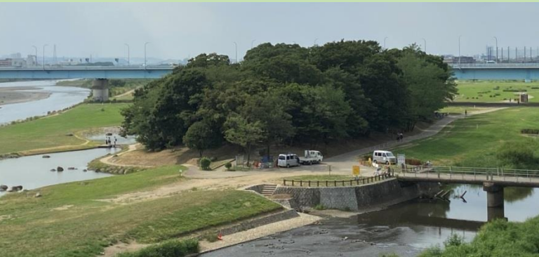
「多摩川八景」に選ばれた二子玉川・兵庫島