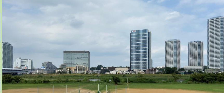
多摩川の対岸（高津区側）から望む二子玉川の高層建築物

大山街道の東京側の端、多摩川をはさみ高津区の対岸にあたる「二子玉川」は、時代と共にさまざまな貌を見せてきました。多摩川という自然に接することができる一方、現在は大型商業施設にたくさんの人が集う街となっています。