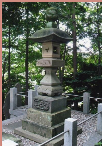
長津田 上宿常夜灯