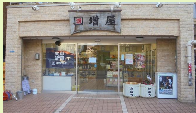
増屋商店は大山街道沿いで営業されている 酒屋さんです(高津区溝口)