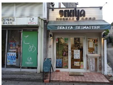
▲関屋精米店：高津区久本

全国から取り寄せた自慢のお米の話を聞きながら、おいしいごはんの味をゆったり楽しみましょう。